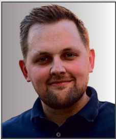
Andreas Boldt Klinikum Bielefeld