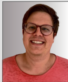
Pascal Joswig Stiftungs- klinikum Proselis – Prosper- Hospital Reckling- hausen